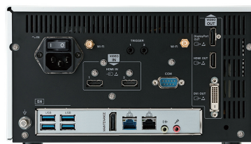
UR-NEXT4KH (modelo HDMI)