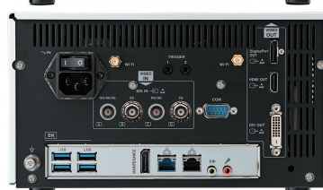
UR-NEXT4KS (modelo SDI)